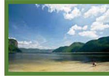
Luc Rousseau © SÉPAQ