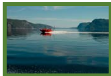
Martin Thibeault © SÉPAQ