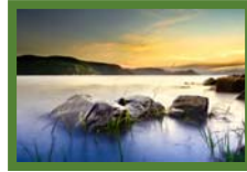
Luc Rousseau © SÉPAQ